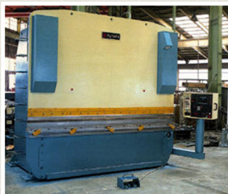
▲MP30030TN1型 油圧プレスブレーキ