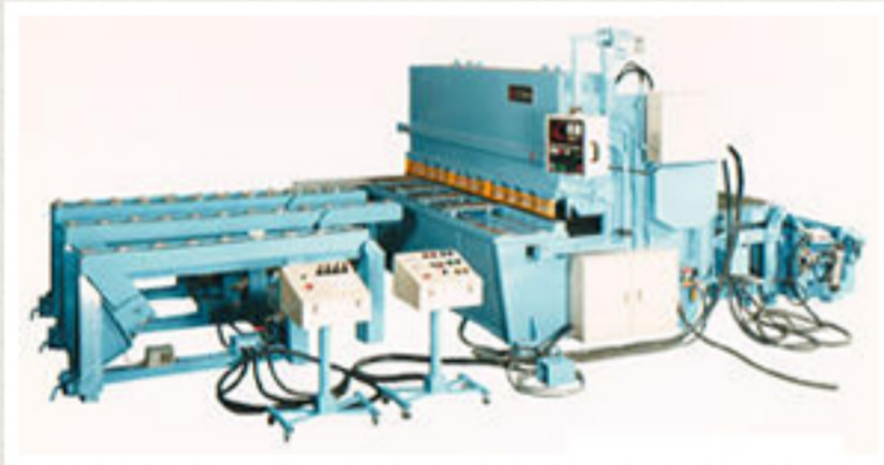
▲油圧ギャップシャーリングラインマシン