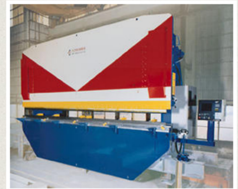
▲MP30070TN型 油圧プレスブレーキ