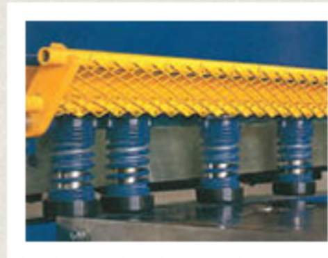
▲板押えシリンダー